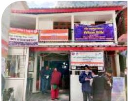
गंगोत्री धाम सितम्बर 2021