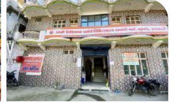
बड़कोट सितम्बर 2017