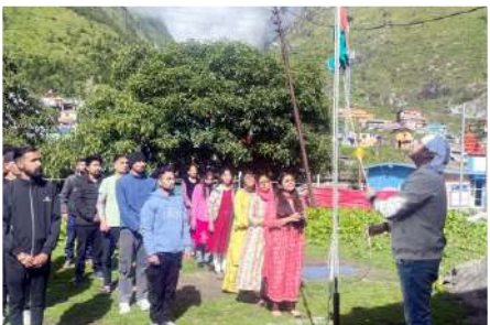
श्री बद्रीनाथ धाम