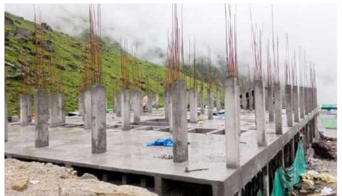
निर्माणाधीन नवीन चिकित्सालय