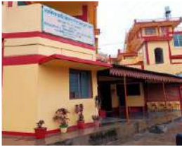
डुमेट दिसम्बर 2021