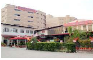
धर्मावाला सितम्बर 2012