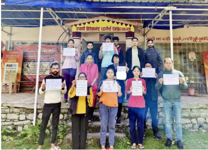
श्री बद्रीनाथ धाम

कोलकाता के आर जी कर मेडिकल कॉलेज एंड हॉस्पिटल में प्रशिक्षु डॉक्टर के साथ दुष्कर्म की घटना के विरोध में स्वामी विवेकानन्द हेल्थ मिशन सोसाइटी के सभी चिकित्सालयों में दिनांक 17 अगस्त को इमरजेंसी छोड़ बाकी सभी सेवाएं इंडियन मेडिकल एसोसिएशन के आह्वान पर 24 घंटों के लिए बंद रखी गयीं। इस अवसर पर दिवंगत आत्मा की शान्ति के लिए एक मिनट का मौन रखा गया व कैंडल मार्च भी निकाला गया।