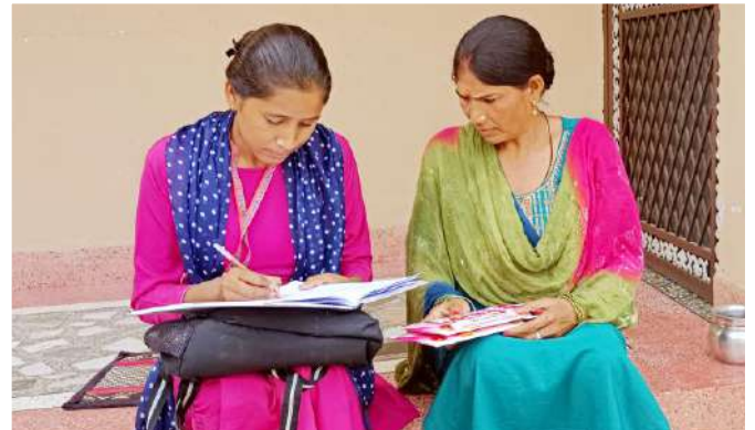
माई पैड कार्यक्रम