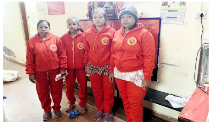
तीर्थयात्री गरम ट्रैक सूट के साथ