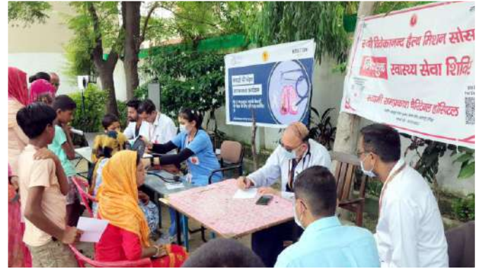
हरिद्वार चिकित्सालय : टी बी मुक्त अभियान

कुल शिविर: 4, कुल लाभार्थी: 160, कुल एक्स-रे: 128, कुल टी बी रोगी: 5