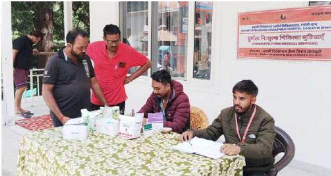
भैरव घाटी, गंगोत्री धाम