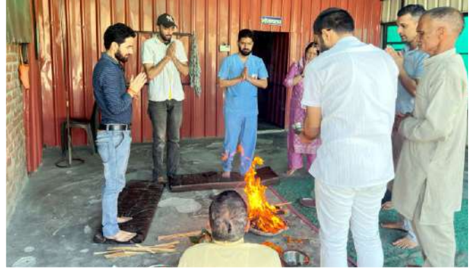
बड़कोट चिकित्सालय : हवन पूजन

दिनांक 23 सितम्बर को स्वामी विवेकानन्द धर्मार्थ चिकित्सालय बड़कोट ने अपना सातवां स्थापना दिवस अत्यंत हर्षोल्लास व उत्साह से मनाया। चिकित्सालय परिसर में आयोजित इस समारोह में सभी डॉक्टर व स्टाफ ने बढ़-चढ़कर भाग लिया व चिकित्सालय की सज्जा भी करी। आयोजित कार्यक्रमों में विधिवत हवन पूजन कर चिकित्सालय की उन्नति के लिए प्रार्थना की गयी तत्पश्चात चिकित्सालय के सात वर्षों की उपलब्धियां बताई गयीं व जलपान के साथ समापन किया गया।