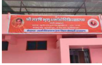
उत्तरकाशी दिसम्बर 2016