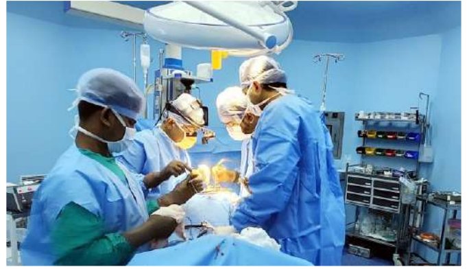
स्पाइन सर्जरी शिविर