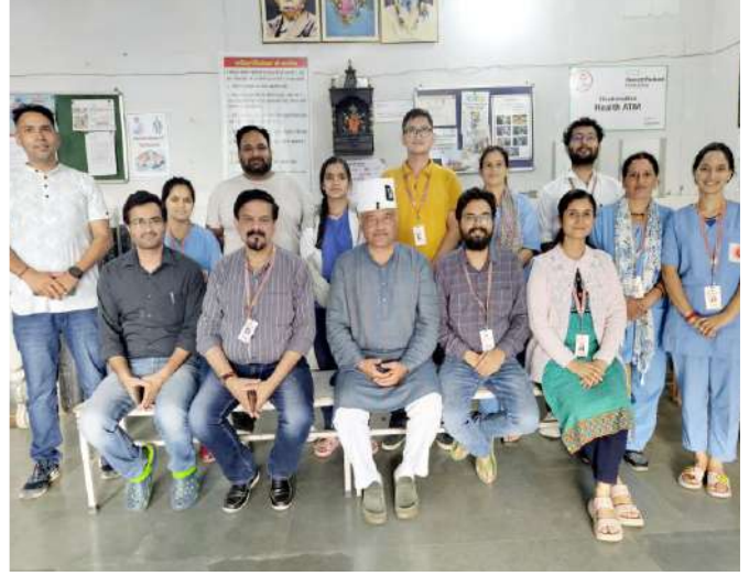
नारायणकोटी चिकित्सालय: कर्नल अजय कोठियाल

28 सितम्बर: माधव चिकित्सालय, नारायणकोटी में कीर्ति चक्र, शौर्य चक्र एवं विशिष्ट सेवा मेडल से सम्मानित कर्नल अजय कोठियाल का प्रवास हुआ। उन्होंने चिकित्सालय का अवलोकन किया और स्वास्थ्य सेवाओं की सराहना की। कर्नल कोठियाल यूथ फाउंडेशन के संस्थापक हैं, जो भारतीय सेना, अर्धसैनिक बल और अन्य सैन्य बलों में शामिल होने के लिए युवाओं को निःशुल्क प्रशिक्षण प्रदान करके उत्तराखण्ड के लोगों के उत्थान के लिए प्रतिबद्ध है। उन्होंने चिकित्सालय के डॉक्टरों व स्टाफ की समर्पण भावना की प्रशंसा करते हुए कहा की वे समुदाय की सेवा में अपना सर्वश्रेष्ठ योगदान दे रहे हैं व आशा व्यक्त की कि चिकित्सालय आने वाले समय में और भी उत्कृष्ट स्वास्थ्य सेवाएं प्रदान करता रहेगा।