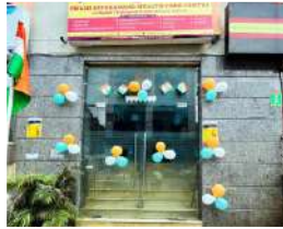
दिल्ली सितम्बर 2022