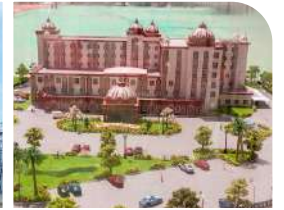
वृन्दावन जून 2024

स्वामी विवेकानन्द हैल्थ मिशन सोसाइटी का गठन सन् 2012 में कुछ युवा चिकित्सकों एवं सेवाभावी लोगों के द्वारा मानव सेवा हेतु किया गया था और जिनका लक्ष्य दुर्गम, पिछड़े, पहाड़ी, ग्रामीण एवं जनजातीय क्षेत्रों व तीर्थस्थलों में उपेक्षित और शोषित वर्ग तथा तीर्थयात्रियों की सेवा करके मातृभूमि की वंदना करना और उन्हें चिकित्सीय सुविधा, शिक्षा और सामाजिक सुदृढ़ता प्रदान करना है।