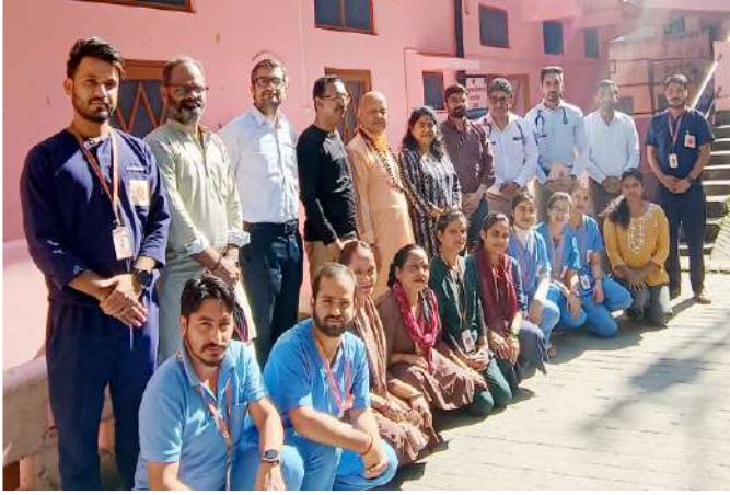
वालंटियर डॉक्टरों की टीम