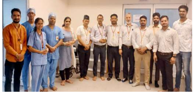
धर्मावाला चिकित्सालय: नेत्र रोग विभाग की टीम

स्वामी विवेकानन्द धर्मार्थ चिकित्सालय धर्मावाला ने एक और उपलब्धि प्राप्त कर ली जब दिनांक 28 जुलाई को प्रथम मोटियाबिंद का ऑपरेशन सफलतापूर्वक अत्याधुनिक फेको मशीन द्वारा संपन्न हुआ। इस अत्याधुनिक सुविधा से धर्मावाला चिकित्सालय के आस पास व सुदूर जनजातीय, दुर्गम, पिछड़े व पहाड़ी क्षेत्र के रोगियों को अत्यंत लाभ मिलेगा। धर्मावाला चिकित्सालय के नवीन भवन के चौथे तल पर स्थित इस नव्य नेत्र रोग विभाग में सभी प्रकार के नेत्र रोगों का निदान एवं उपचार किया जा रहा है।