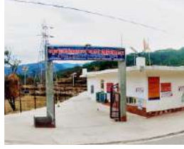
पेटशाल जुलाई 2019