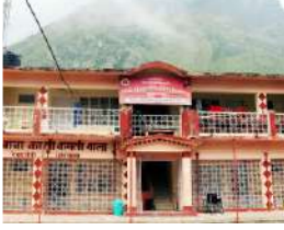
श्री बद्रीनाथ धाम मई 2019