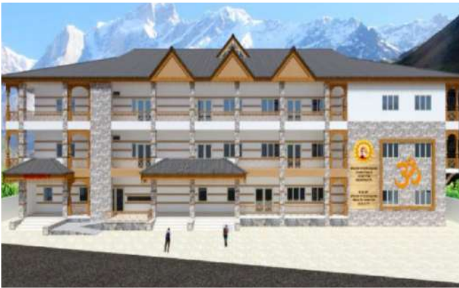
नवीन चिकित्सालय का प्रारूप