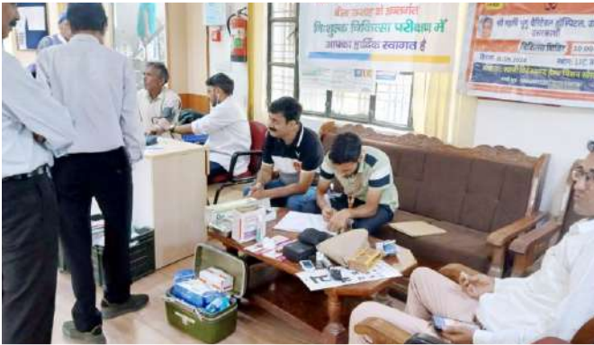
LIC भवन में चिकित्सा शिविर