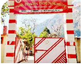
पीपलकोटी जनवरी 2018