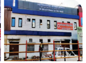
हरिद्वार जनवरी 2021