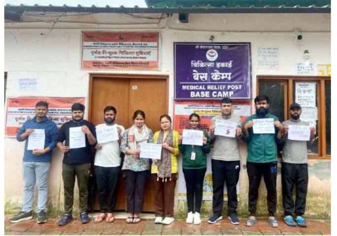
श्री केदारनाथ धाम