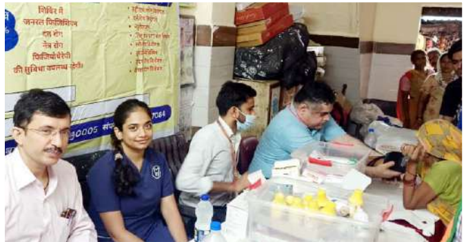
आंगनवाड़ी केंद्र 350 बस्ती, करोल बाग, दिल्ली