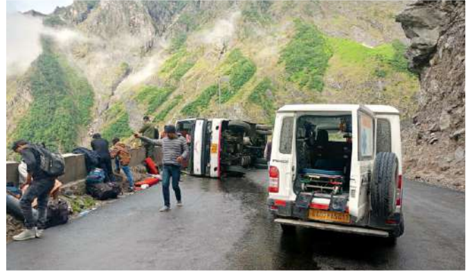
दुर्घटनास्थल पर श्री बद्रीनाथ धाम चिकित्सालय की एंबुलेंस