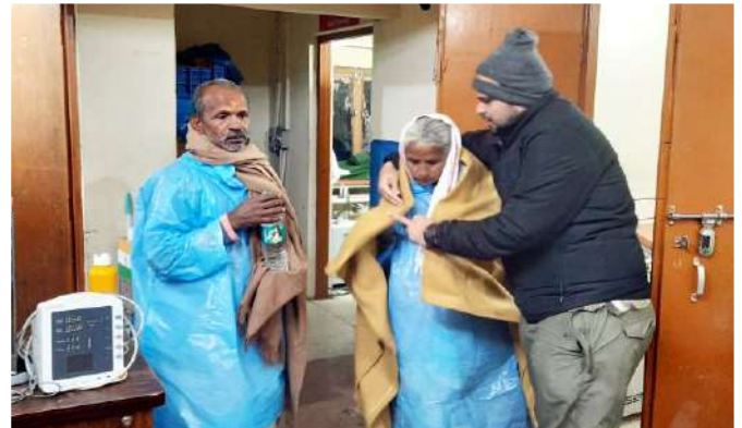
तीर्थयात्री कंबल व रेनकोट के साथ