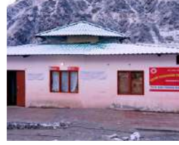
श्री केदारनाथ धाम सितम्बर 2019