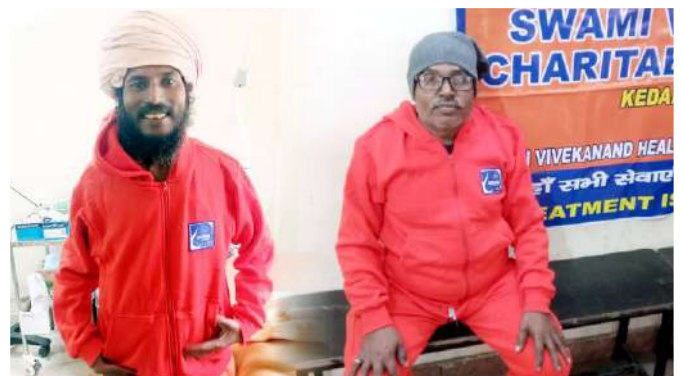
तीर्थयात्री गरम ट्रैक सूट पहने हुए