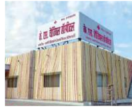
फिरोजाबाद फरवरी 2024