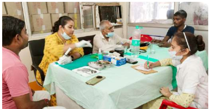
ग्राम राजा का ताल, पूजा ग्लास प्राइवेट लिमिटेड, फिरोज़ाबाद