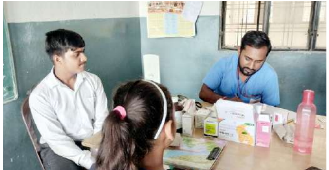
सरस्वती विद्या मंदिर बाबूगढ़, धर्मावाला