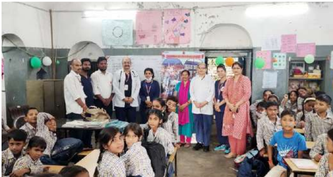
राजकीय प्राथमिक विद्यालय, विष्णु गार्डन, हरिद्वार