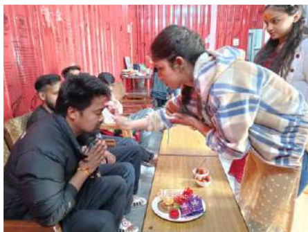
श्री बद्रीनाथ धाम