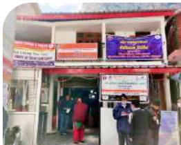
गंगोत्री धाम सितम्बर 2021