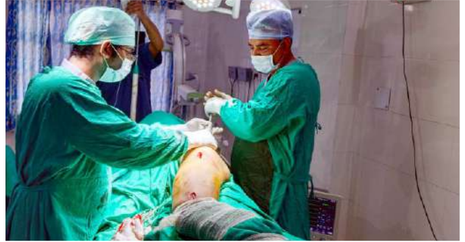
नारायणकोटी 25 अप्रैल और 28 जून