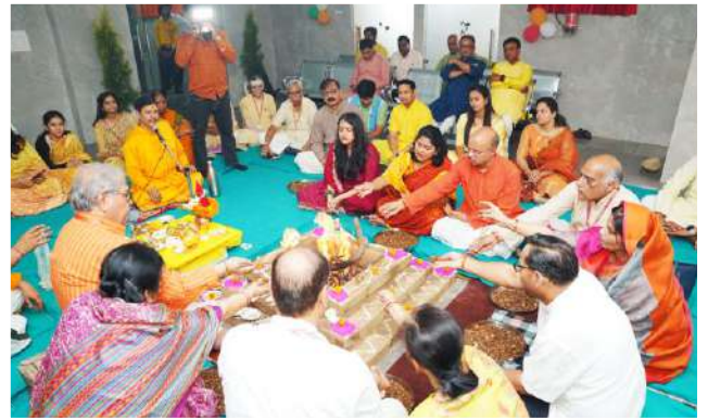
हवन से साथ शुभारम्भ