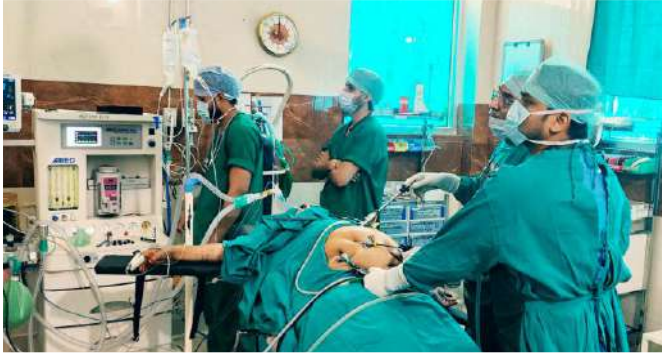
पेटशाल 5 मई