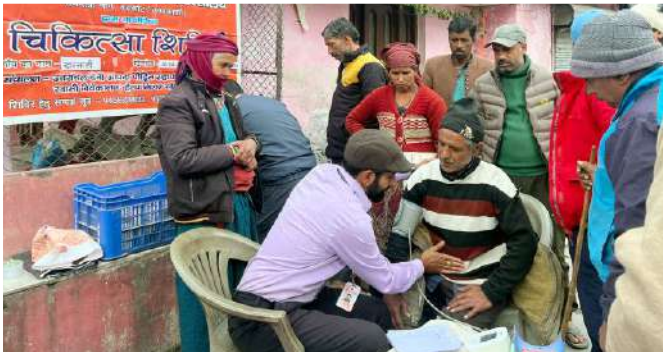
खरसाली, जानकी चट्टी, बड़कोट