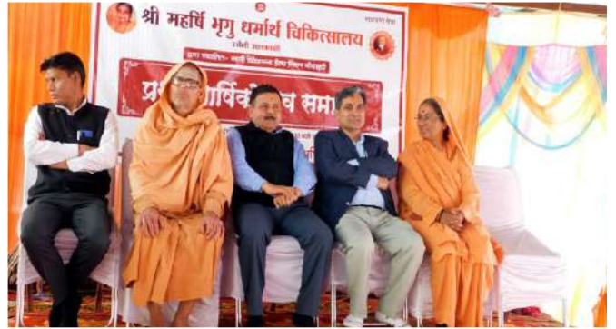
मंचासीन मुख्य अतिथिगण