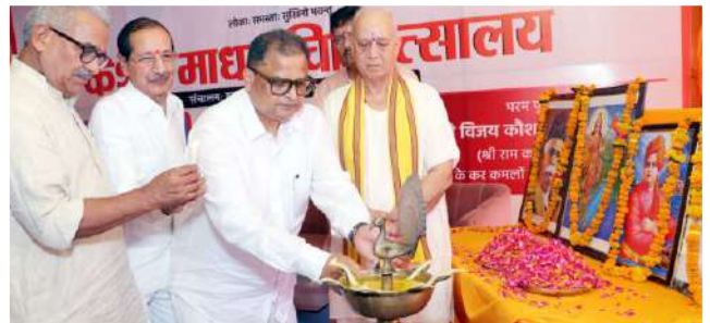
अतिथियों द्वारा दीप प्रज्वलन