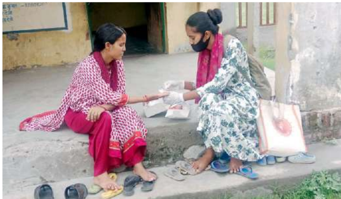
एनीमिया की रोकथाम, नियंत्रण एवं उपचार कार्यक्रम