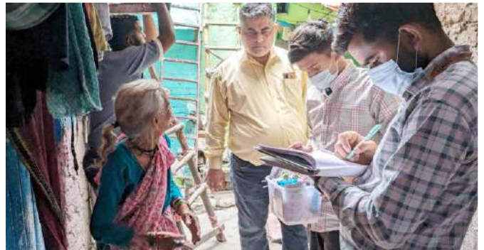
करोल बाग दिल्ली