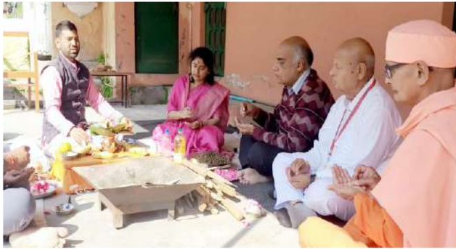
हवन के साथ शुभारंभ