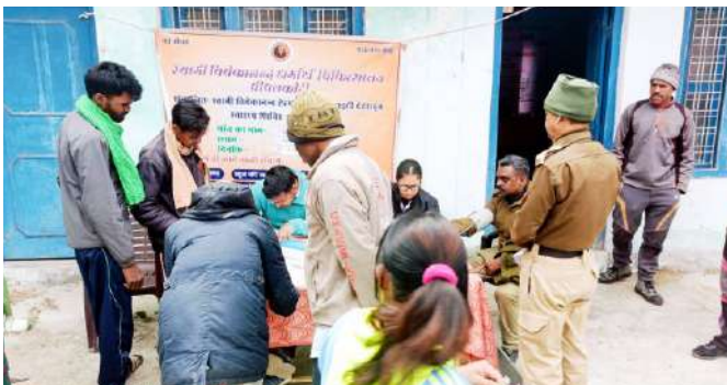
सुरई टोटा, पीपलकोटी