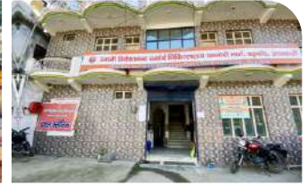
बड़कोट सितम्बर 2017