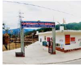
पेटशाल जुलाई 2019