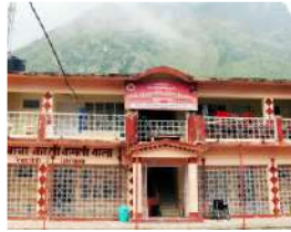
श्री बद्रीनाथ धाम मई 2019