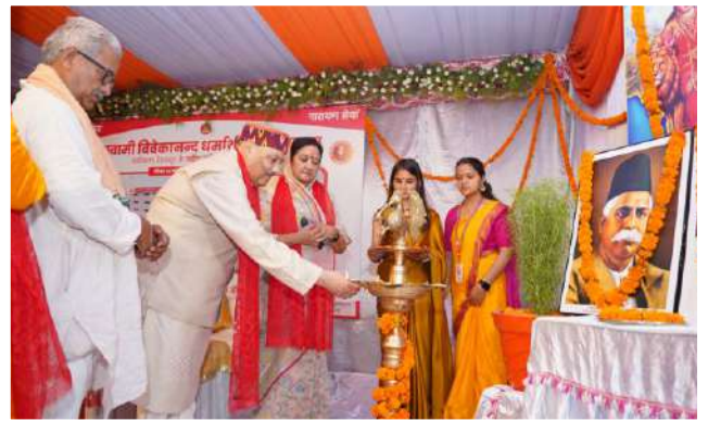
अतिथियों द्वारा दीप प्रज्ज्वलन