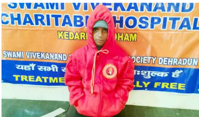
तीर्थयात्री जैकेट पहने हुए