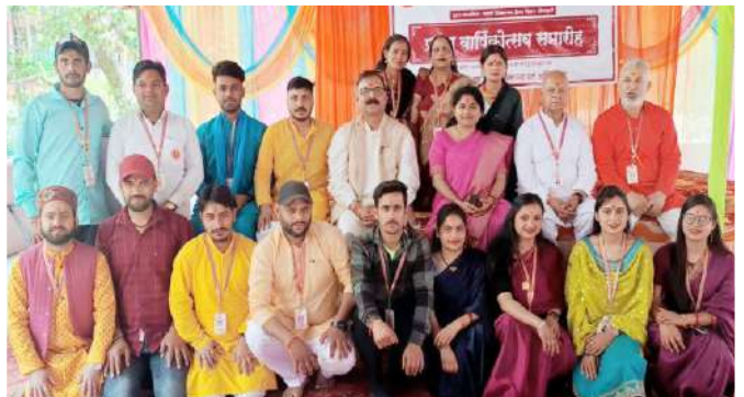
उत्तरकाशी चिकित्सालय की टीम

स्वामी विवेकानन्द हैल्थ मिशन सोसाइटी द्वारा संचालित श्री महर्षि भृगु धर्मार्थ चिकित्सालय, उजेली उत्तरकाशी का प्रथम वार्षिकोत्सव पूरे हर्ष व उल्लास से मनाया गया।