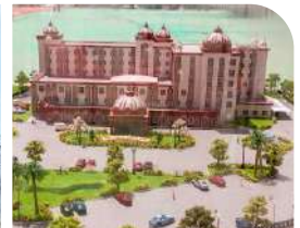
वृन्दावन जून 2024

स्वामी विवेकानन्द हैल्थ मिशन सोसाइटी का गठन सन् 2012 में कुछ युवा चिकित्सकों एवं सेवाभावी लोगों के द्वारा मानव सेवा हेतु किया गया था और जिनका लक्ष्य दुर्गम, पिछड़े, पहाड़ी, ग्रामीण एवं जनजातीय क्षेत्रों व तीर्थस्थलों में उपेक्षित और शोषित वर्ग तथा तीर्थयात्रियों की सेवा करके मातृभूमि की वंदना करना और उन्हें चिकित्सीय सुविधा, शिक्षा और सामाजिक सुदृढ़ता प्रदान करना है।