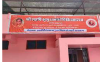
उत्तरकाशी दिसम्बर 2016