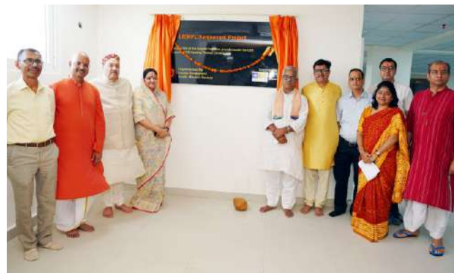
नेत्र रोग विभाग का लोकार्पण