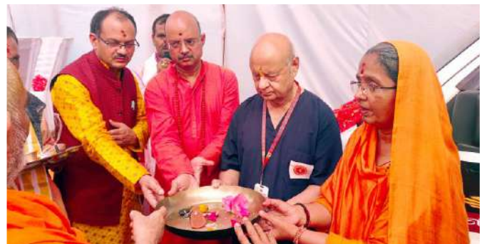
अम्मा जी द्वारा वैन की चाबी मिलती हुई