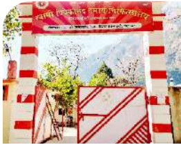
पीपलकोटी जनवरी 2018