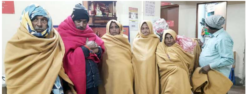
कंबल के साथ तीर्थयात्री