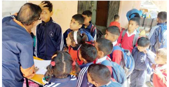
माछ्ठी पोखरी, धर्मावाला