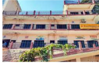
नारायणकोटी मई 2017