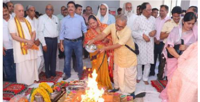
हवन के साथ शुभारम्भ