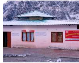
श्री केदारनाथ धाम सितम्बर 2019