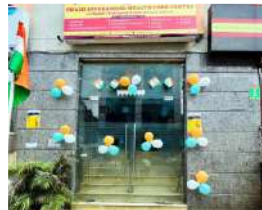
दिल्ली सितम्बर 2022