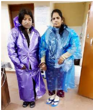
रेनकोट के साथ तीर्थयात्री

हमारे पूर्णतः निःशुल्क धाम चिकित्सालय में स्वास्थ्य सेवाओं के अतिरिक्त कुछ अन्य निःशुल्क सेवाएं भी सम्मिलित हैं जिनमें है कंबलों का वितरण, हीटर, और अलाव की व्यवस्था, ट्रेक सूट, रेनकोट व चप्पलों का वितरण तथा गर्म चाय और बिस्कुट की व्यवस्था। इसी क्रम में 348 कम्बल, 275 ट्रेक सूट, 57 रेनकोट, 363 जोड़ी चप्पलें, 95 लोअर, 14500 से अधिक चाय व 8565 से अधिक प्रोटीन एनर्जी बार का वितरण किया गया।