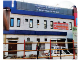
हरिद्वार जनवरी 2021