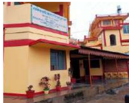
डुमेट दिसम्बर 2021