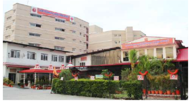
नवीन ब्लॉक धर्मावाला चिकित्सालय