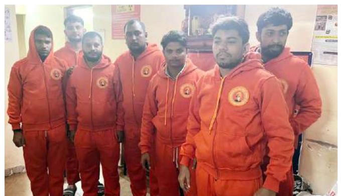
तीर्थयात्री ट्रैक सूट पहने हुए