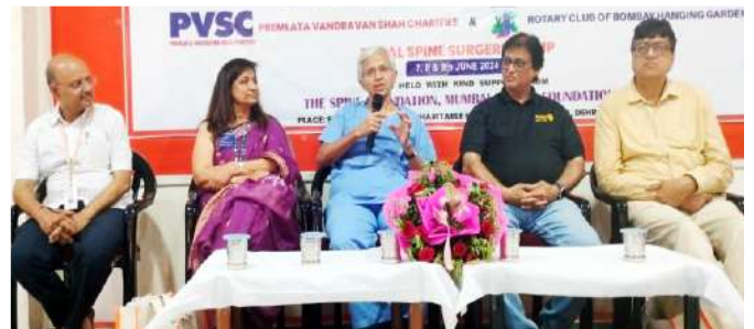
मंचासीन मुख्य अतिथिगण