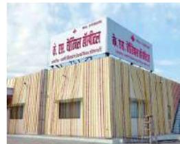
फिरोजाबाद फरवरी 2024