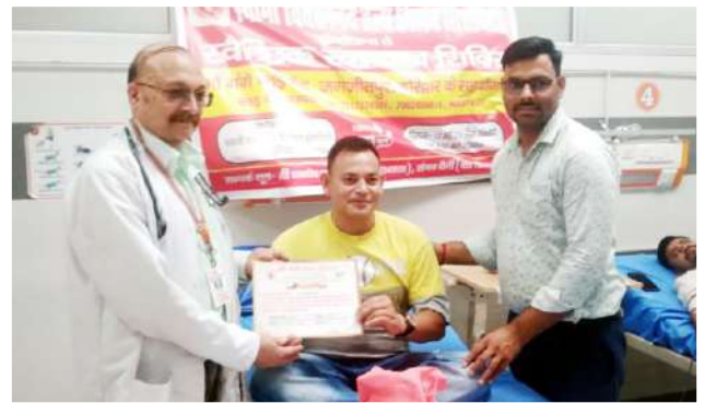
हरिद्वार रक्तदान शिविर