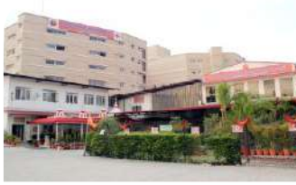
धर्मावाला सितम्बर 2012