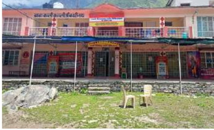
श्री बद्रीनाथ धाम हॉस्पिटल