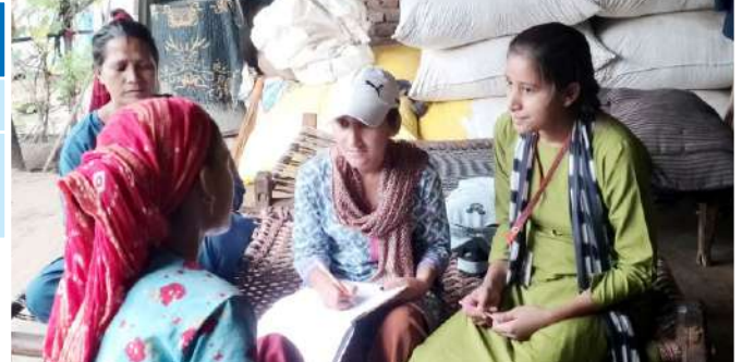
मासिक धर्म स्वच्छता कार्यक्रम

हमारे इस कार्यक्रम से लगभग 3500 महिलाएँ नियमित रूप से सेनेटरी पैड का उपयोग कर रही हैं और मासिक धर्म सम्बन्धी स्वच्छता का पालन कर रही हैं।