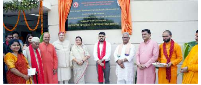
भूतल ब्लॉक का लोकार्पण