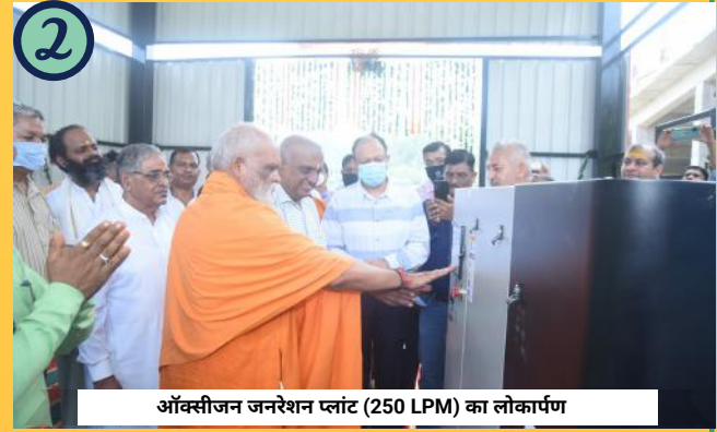
ऑक्सीजन जनरेशन प्लांट (250 LPM) का लोकार्पण