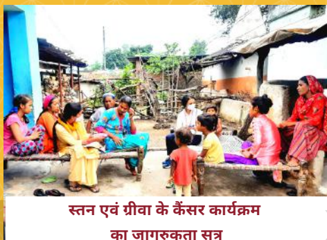
स्तन एवं ग्रीवा के कैंसर कार्यक्रम का जागरूकता सत्र