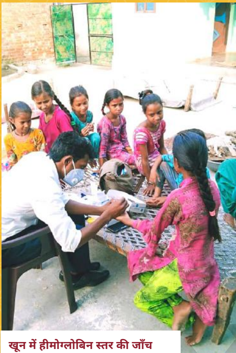
खून में हीमोग्लोबिन स्तर की जाँच