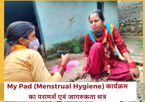
My Pad (Menstrual Hygiene) कार्यक्रम का परामर्श एवं जागरूकता सत्र