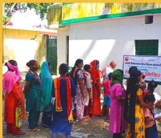
09-09-2021 : खाला शास्त्रीनगर शहरी मलिन बस्ती, देहरादून