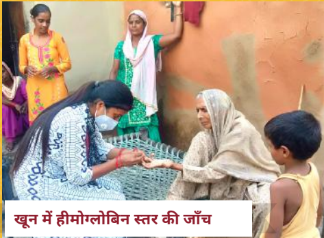
खून में हीमोग्लोबिन स्तर की जाँच