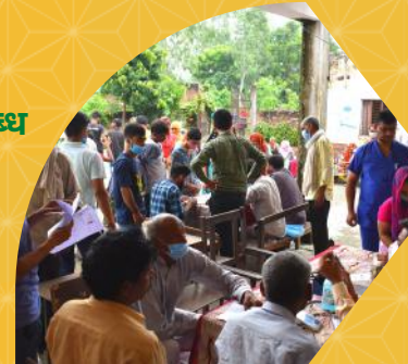
19-08-2021 : तेलीवाला गाँव, हरिद्वार