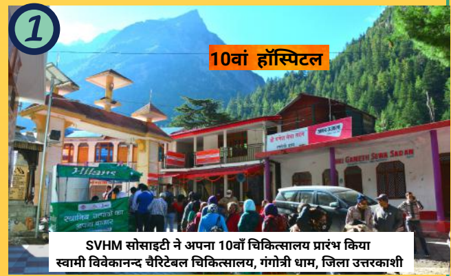
SVHM सोसाइटी ने अपना 10वां चिकित्सालय प्रारंभ किया स्वामी विवेकानन्द चैरिटेबल चिकित्सालय, गंगोत्री धाम, जिला उत्तरकाशी