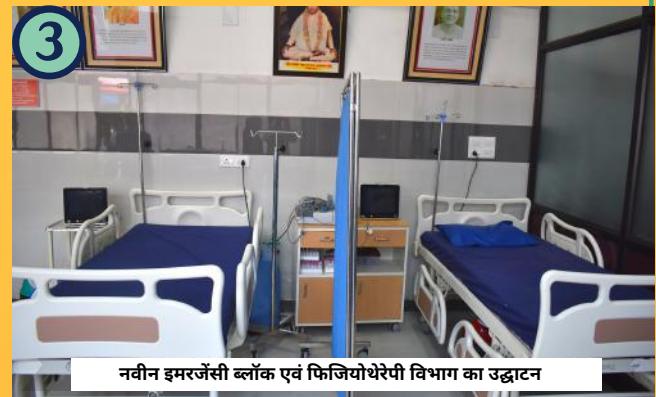
नवीन इमरजेंसी ब्लॉक एवं फिजियोथेरेपी विभाग का उद्घाटन