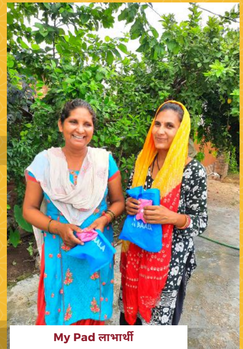
My Pad लाभार्थी