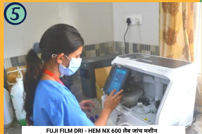
FUJI FILM DRI - HEM NX 600 लैब जांच मशीन