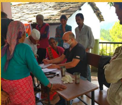
24-09-2021: अरसलपाड गाँव, पेटशाल

मौसमी स्वास्थ्य समस्याओं और बीमारी से जूझ रहे ग्रामीणों के लिए यह शिविर एक बड़ी राहत थी। हमेशा की तरह, दवाओं सहित सभी सुविधाएँ पूरी तरह से निःशुल्क प्रदान की गईं।