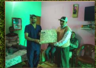
पीपलकोटी - उपहार वितरण