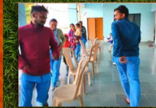
नारायणकोटी - खेल सत्र