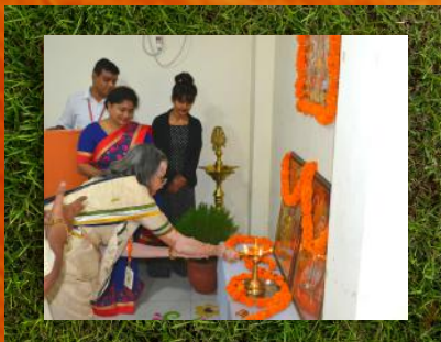
धर्मावाला - द्वीप प्रज्वलन