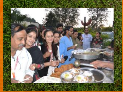
धर्मावाला - कार्यक्रम पश्चात मधुर भोज