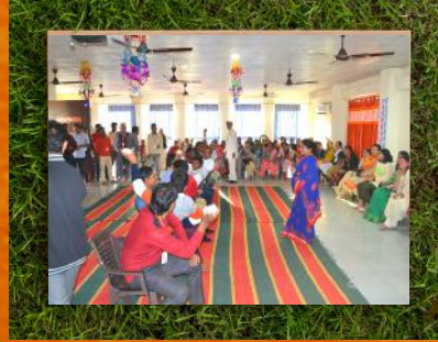
धर्मावाला - खेल सत्र