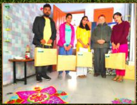
मनेरी - उपहार वितरण