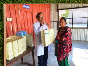
बड़कोट - उपहार वितरण