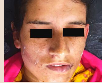
ऑपरेशन के बाद