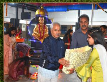
हरिद्वार - उपहार वितरण