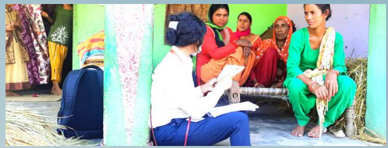
स्तन एवं ग्रीवा के कैंसर का जागरूकता सत्र