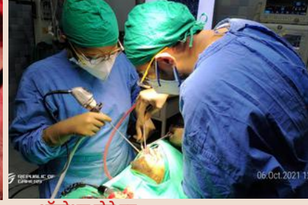
ऑपरेशन होते हुए