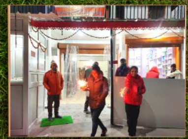
गंगोत्री धाम - दीपावली मानते हुए