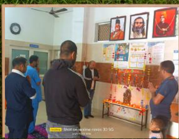
पेटशाल - द्वीप प्रज्वलन एवं पूजन