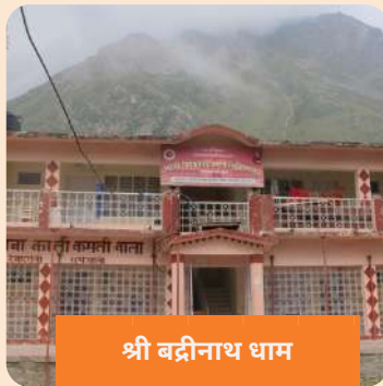
श्री बद्रीनाथ धाम