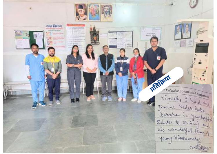
नारायणकोटी केंद्र को श्री तरूण विजय जी (पूर्व राज्यसभा सांसद) के स्वागत सत्कार का सौभाग्य प्राप्त हुआ।