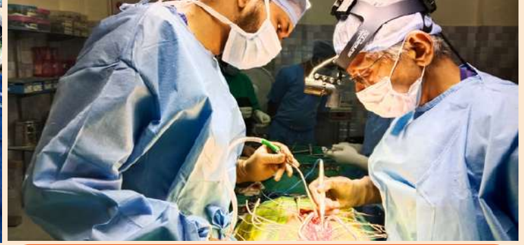
द स्पाइन फाउंडेशन टीम धर्मावाला डॉक्टरों के साथ