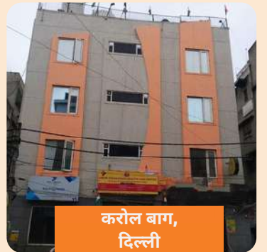
करोल बाग, दिल्ली