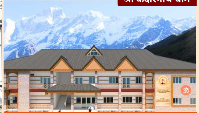
प्रस्तावित नये श्री केदारनाथ धाम चिकित्सालय का प्रारूप

सोसाइटी श्री केदारनाथ धाम में गत 4 वर्षों से ICU युक्त पूर्णतः निःशुल्क चिकित्सालय चला रही है और अकेले पिछले वर्ष 1,13,000 से अधिक रोगियों का उपचार किया। वर्तमान चिकित्सालय 8 बेड का है और सीमित स्थान व अभाव के चलते, प्रतिदिन औसतन 1000 तीर्थयात्रियों की बड़ी संख्या की देखभाल करने में कठिनाई का सामना कर रहा है। इस समस्या को दूर करने के उद्देश्य से एक 50 बेड वाला उन्नत चिकित्सालय का निर्माण किया जा रहा है जिसमें तीर्थयात्रियों को अत्याधुनिक स्वास्थ्य सुविधाएं उपलब्ध होंगी। सोसाइटी ने इस चिकित्सालय के लिए भूमि खरीद ली है और निर्माण कार्य शुरू भी हो गया है। इसी प्रकार श्री बद्रीनाथ धाम चिकित्सालय का भी विस्तार चल रहा है और जल्द ही कार्य शुरू हो जाएगा।