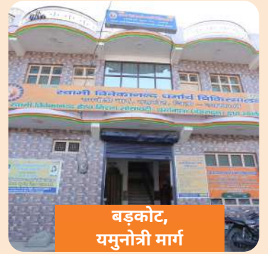
बड़कोट, यमुनोत्री मार्ग