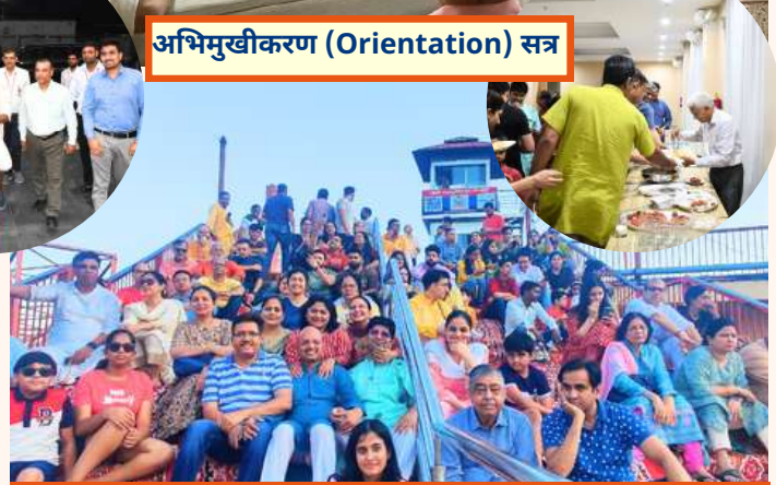
हर की पौड़ी पर गंगा आरती के दौरान आत्मिक अनुभव के क्षण