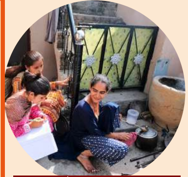
फॉलो अप विजिट एवं परामर्श सत्र