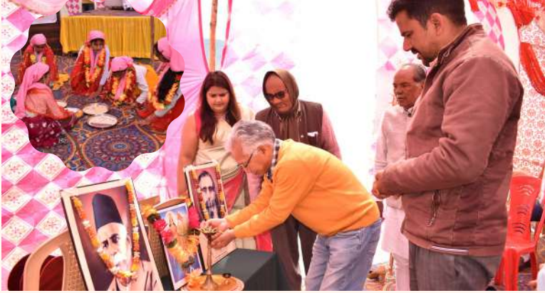
मुख्य अतिथि दीप प्रज्वलित करते हुए

इस वर्ष 2 अप्रैल को नारायणकोटी चिकित्सालय का छठा स्थापना दिवस मनाया गया। इस अवसर पर अनेक गणमान्य व्यक्तियों की गरिमामयी उपस्थिति रही, इनमें प्रमुख रूप से अधोलिखित नाम रहे: