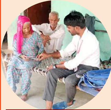
फॉलो अप विजिट एवं परामर्श सत्र