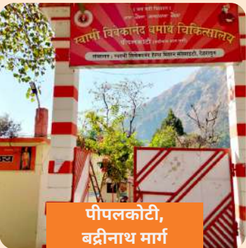
पीपलकोटी, बद्रीनाथ मार्ग