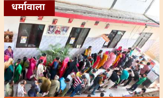
पंजीकरण की पंक्ति