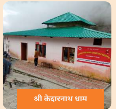
श्री केदारनाथ धाम