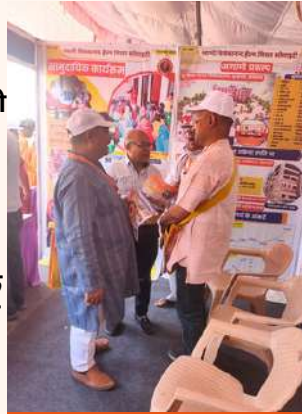
राष्ट्रीय सेवा संगम में SVHM स्टॉल

हमारी संस्था के धर्मार्थ प्रयासों और सेवाओं के बारे में अधिक जानकारी के लिए अनेक प्रतिनिधियों ने स्टाल पर संपर्क किया।