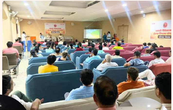
अभिमुखीकरण (Orientation) सत्र