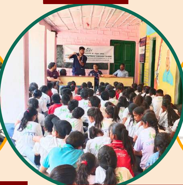
दंत चिकित्सा शिविर - पेटशाल