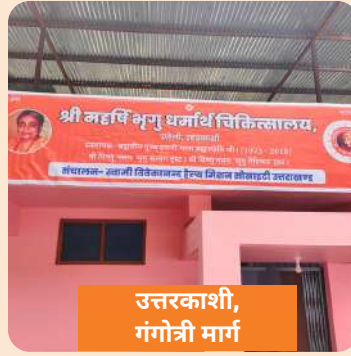
उत्तरकाशी, गंगोत्री मार्ग