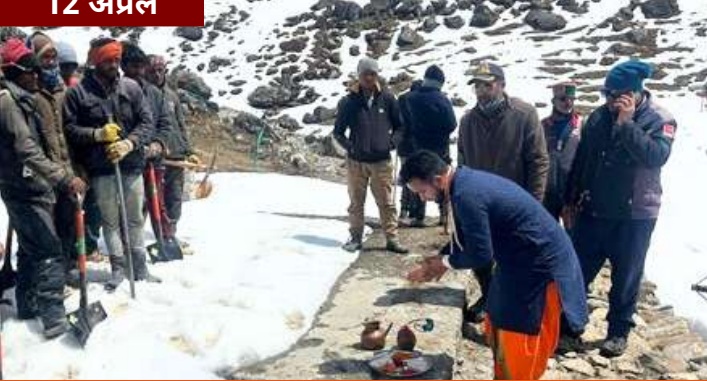
श्री केदारनाथ धाम में प्रस्तावित नये चिकित्सालय का भूमिपूजन