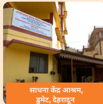
साधना केंद्र आश्रम, डुमेट, देहरादून