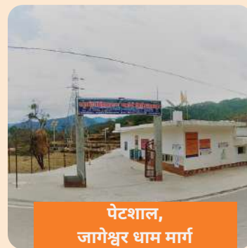
पेटशाल, जागेश्वर धाम मार्ग