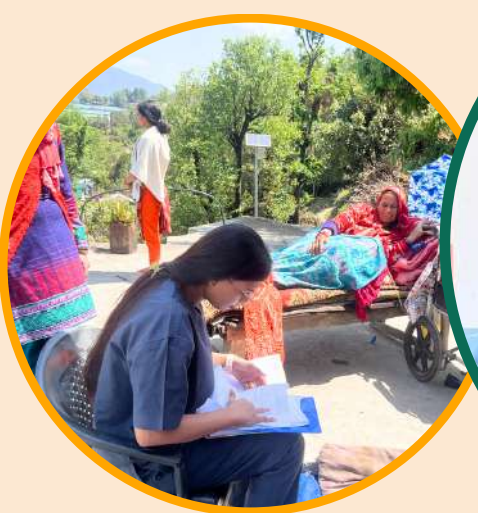
स्पाइन कैंप - नारायणकोटी