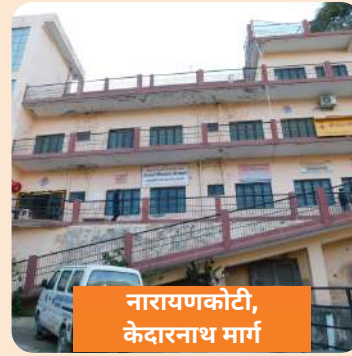
नारायणकोटी, केदारनाथ मार्ग