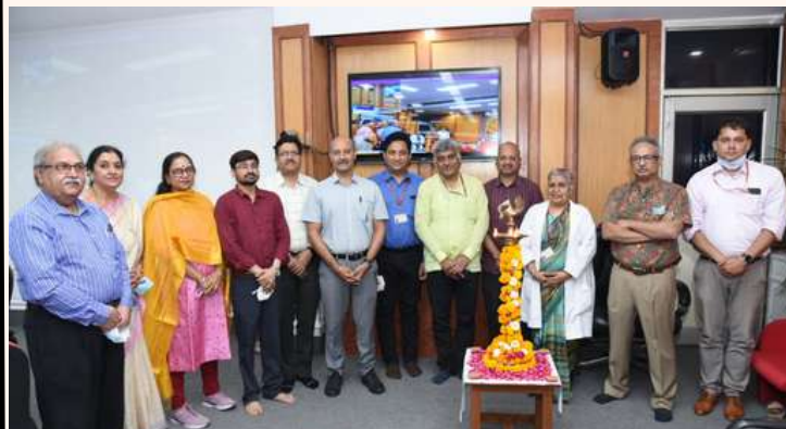
SVHM टीम के साथ AIIMS दिल्ली की टीम