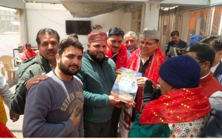
श्री पुष्कर सिंह धामी जी (माननीय मुख्यमंत्री, उत्तराखण्ड)